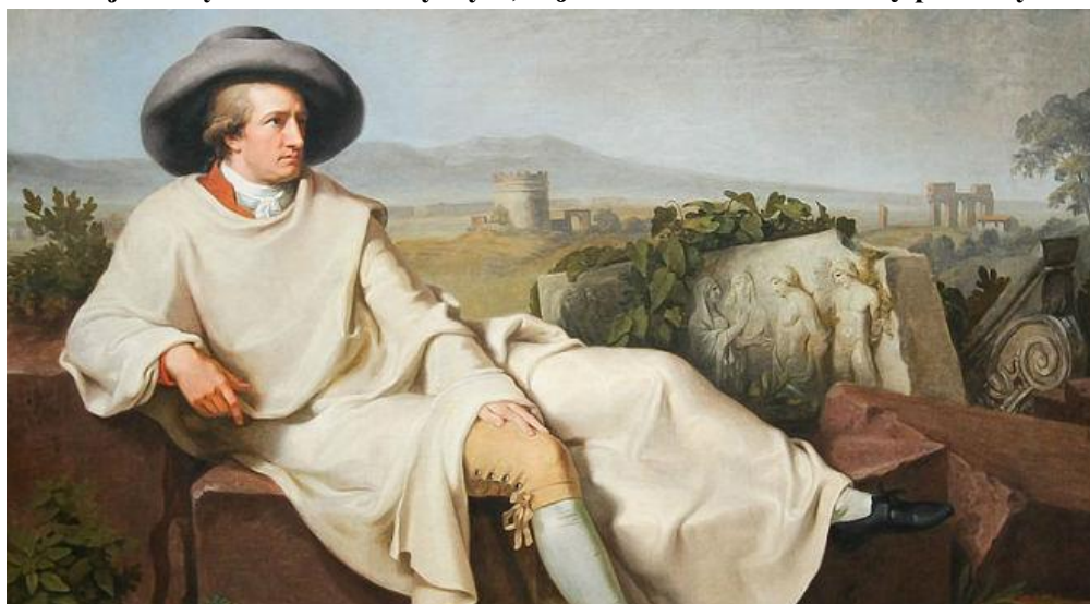
Städel Museum, Frankfurt am Main